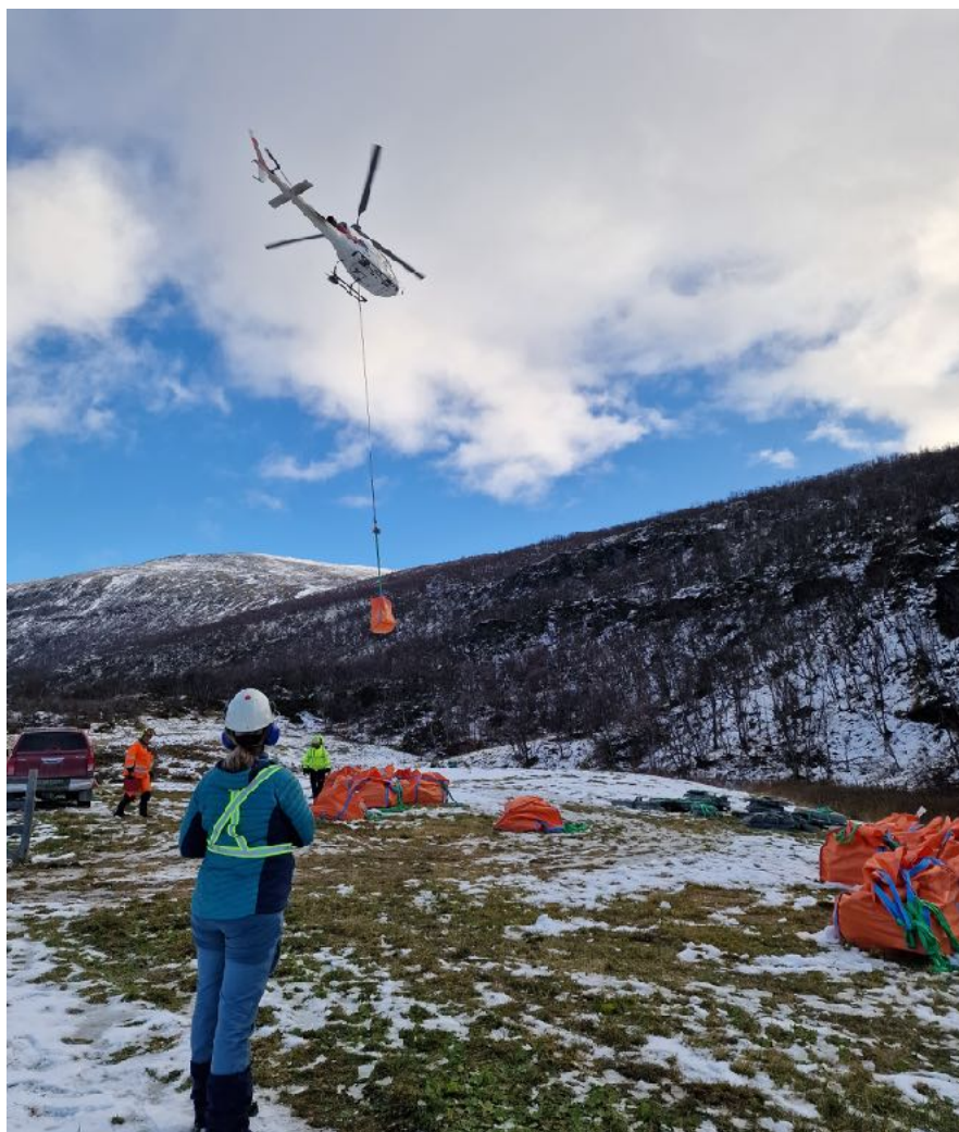
Tråkkstein flys inn på strekningen Kongsvoll - Vårstigen i Drivdalen