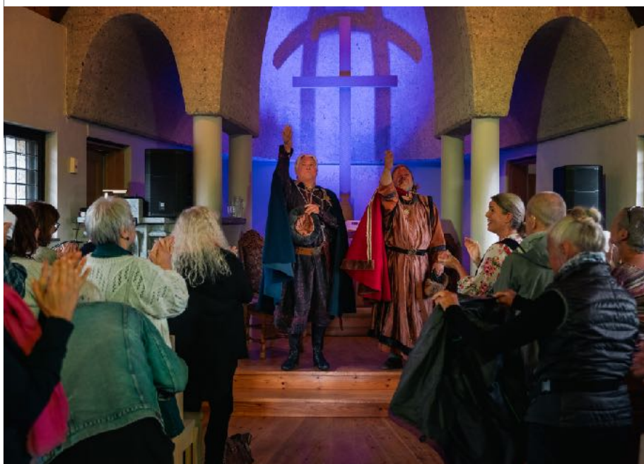
Kong Eystein, konge 1103-1123, ble markert med spel i Eysteinkyrkja på Hjerkin. Fortsettelse følger i 2024.